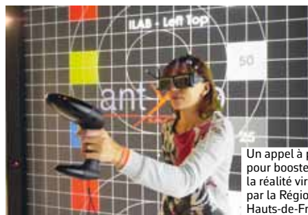
Un appel à projets pour booster la réalité virtuelle par la Région Hauts-de-France

Fabricants, donneurs d'ordre, industriels et autres sous-traitants se retrouvent en Allemagne avec un objectif : dessiner les contours de l'industrie de demain. Une industrie qui évolue sans cesse pour s'adapter aux demandes du marché et pour rester compétitive à l'heure du numérique et des nouvelles technologies.