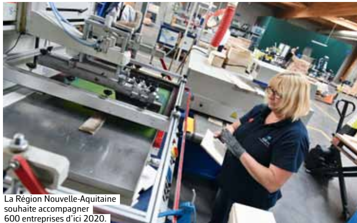
La Région Nouvelle-Aquitaine souhaite accompagner 600 entreprises d'ici 2020.

Aujourd'hui, le programme vise à casser le cercle vicieux selon lequel les PME, du fait de marges limitées, n'investissent pas et voient donc leur productivité stagner et, avec elle, leurs marges... « Nous leur proposons de commencer par miser sur l'organisation industrielle, les conditions de travail et le management et nous les